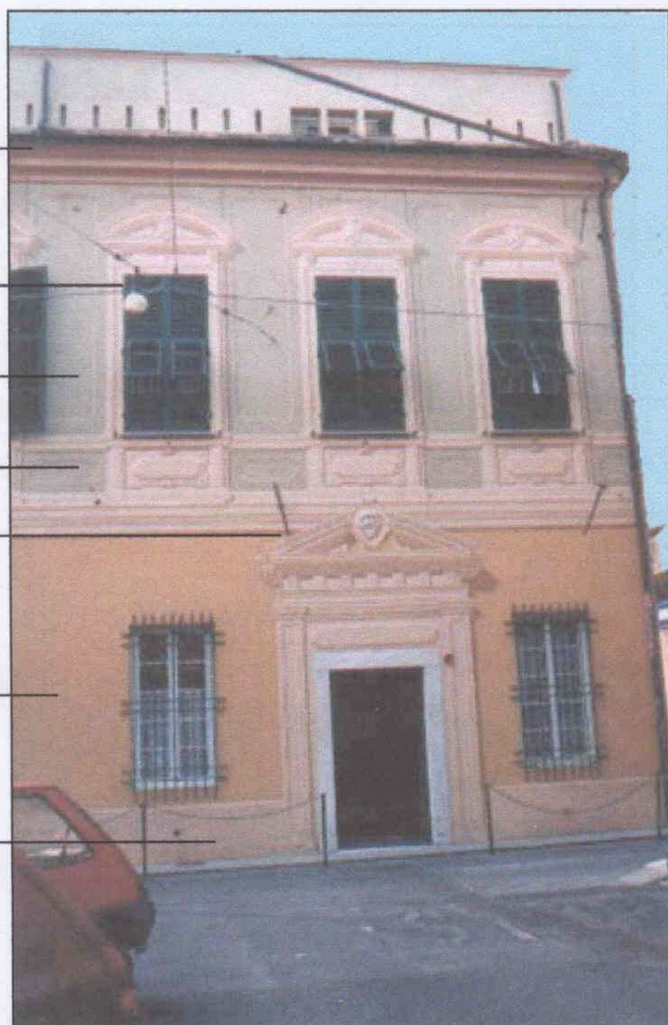
Prospetto via Salomone